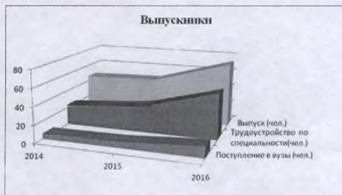
Рисунок 4 – Трудоустройство выпускников колледжа

На рисунке 4 представлена динамика трудоустройства выпускников колледжа за последние 3 года (в % от общего числа выпускников очной и заочной формы обучения).